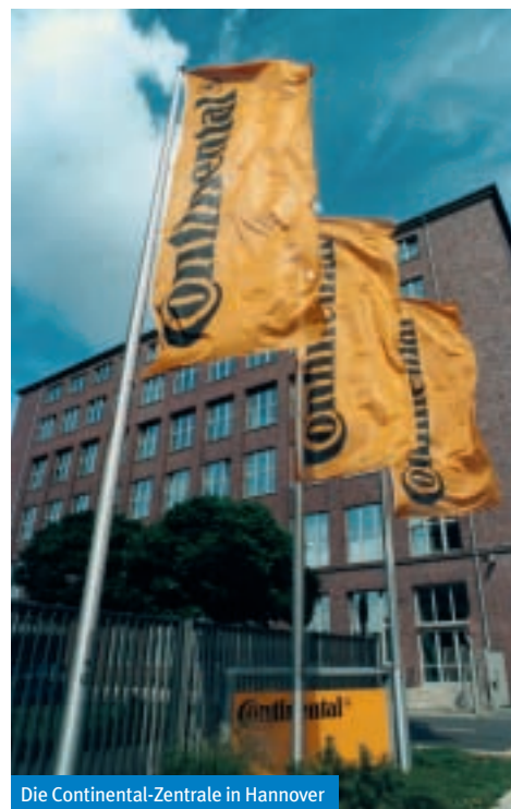
Die Continental-Zentrale in Hannover

Versetzungen und vieles mehr. Das Gutachten der Beratungsfirma hat zudem eindeutig ergeben: Es gibt keine wirtschaftliche Begründung für das Streichkonzert. Die IG Metall ist selbstverständlich bereit, mit der Geschäftsleitung über die Zukunftssicherung von Conti Regensburg zu sprechen. Aber das geht nur ohne Vorbedingungen. Und setzt voraus, dass der Arbeitgeber seine Hausaufgaben macht. Denn die reinen Entgeltkosten machen gerade mal die Hälfte der Werkskosten aus. Wenn gespart werden soll, dann gibt es eine Fülle anderer Möglichkeiten, als ausge-rechnet die Einkommen der Beschäftigten zu kürzen.